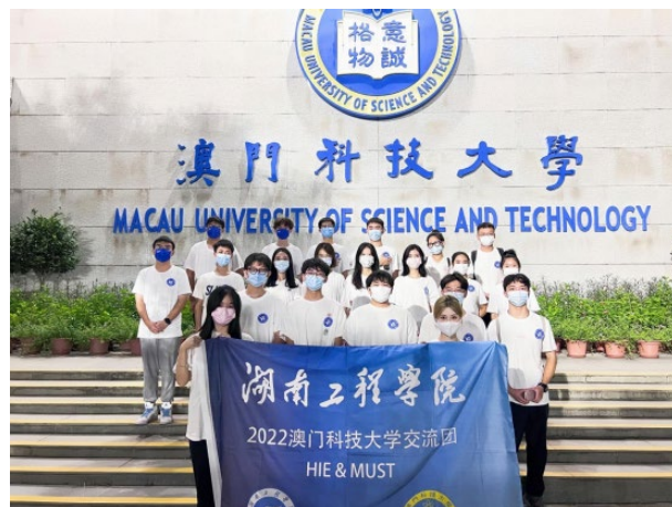
湖南工程学院赴澳科大交流生合影