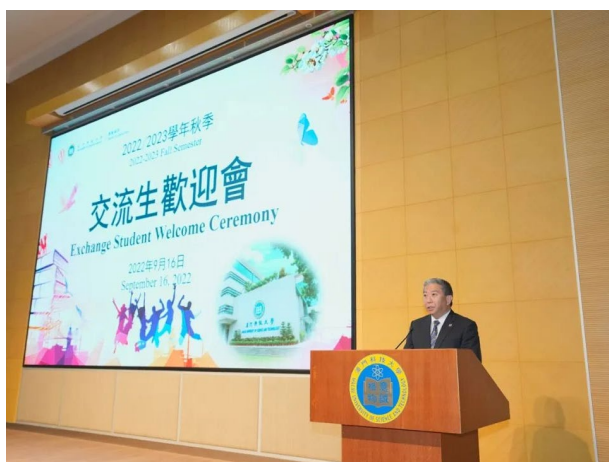
澳科大 2022 秋季学期交流生欢迎会