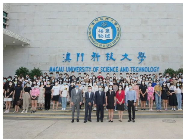
澳科大 2022 秋季学期交流生合影