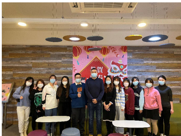
宁夏医科大学赴澳科大交流生心得分享会